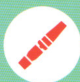
Штатные ремни безопасности