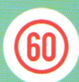
Опознавательный знак «Ограничение скорости»