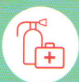
Огнетушитель и аптечка