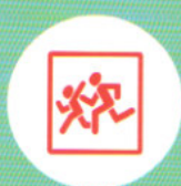
Опознавательные знаки «Перевозка детей»